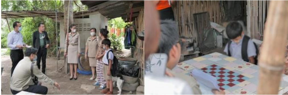
ภาพที่ 1 : เยี่ยมบ้านเด็กและเยาวชนในภาวะวิกฤตทางการศึกษา

ข้อมูลศูนย์ช่วยเหลือเด็กและเยาวชนในภาวะวิกฤตทางการศึกษา กสศ. จังหวัดราชบุรี (ณ กันยายน 2566) พบว่า เด็กและเยาวชนในภาวะวิกฤตทางการศึกษาอาศัยอยู่กับญาติมีจำนวนมาก (ร้อยละ 41.23) รองลงมาคือพักอาศัยอยู่กับพ่อหรือแม่ ข้อมูลดังกล่าวแสดงถึงลักษณะความเป็นอยู่ที่โดดเด่นของเด็กซึ่งสอดคล้องกับการระบุนสาเหตุของการเสี่ยงหลุดจากระบบการศึกษาที่ส่วนใหญ่ได้รับผลกระทบจากปัญหาครอบครัว ครอบครัวของผู้ได้รับทุนมีรายได้รวม/จำนวนสมาชิกเฉลี่ยเท่ากับ 1,250 บาท ในขณะที่ปริมาณหนี้สินของครัวเรือนผู้รับทุนมีค่าเฉลี่ยเท่ากับ 20,000 บาท ข้อมูลนี้สะท้อนให้ถึงภาวะเรื้อรังวิกฤตทางเศรษฐกิจของครอบครัวของเด็กซึ่งอาจส่งผลกระทบต่อความสามารถในการสนับสนุนการศึกษาของบุตรหลานในระยะยาว ผู้รับทุนส่วนใหญ่ประสบปัจจัยเสี่ยงหลุดจากระบบการศึกษาจาก 2 สาเหตุพร้อมกันจำนวนมากที่สุด ได้แก่ ประสบปัญหาด้านเศรษฐกิจและปัญหาครอบครัว การวิเคราะห์เชิงคุณภาพ พบว่า การลงพื้นที่เพื่อเก็บข้อมูลเชิงลึกพบว่า ผู้รับทุน 3 ใน 5 คน ที่เป็นกรณีศึกษาในการศึกษาคั้งนี้อยู่ในครอบครัวแออัด คือกินและมารดาหย่าร้างกัน และ 2 ใน 3 รายถูกทิ้งไว้ให้ผู้สูงอายุเลี้ยงดูโดยไม่ได้ส่งเสียค่าเลี้ยงดูแต่อย่างใด ประกอบกับการประสบปัญหาภาวะยากจนทำให้รายได้ไม่เพียงพอต่อค่าใช้จ่ายในชีวิตประจำวันของทั้งครอบครัว นอกจากนี้พบว่าการไร้สัญชาติของเด็กและเยาวชนเป็นอุปสรรคอย่างยิ่งต่อการให้ความช่วยเหลือเด็กและเยาวชนในภาวะวิกฤตทางการศึกษาอย่างยิ่งย่น แม้ว่าในเบื้องต้นเด็กกลุ่มนี้สามารถได้รับการพิจารณาให้รับทุนการศึกษาจากโครงการได้ แต่มีข้อจำกัดในการให้ความช่วยเหลือในด้านการสร้างอาชีพและรายได้ของผู้ปกครองเพื่อเพิ่มความสามารถในการอุปการะทางการศึกษาได้อย่างต่อเนื่อง